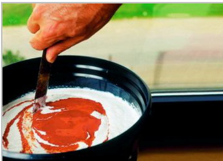
Fase 3 - Miscelare bene il prodotto