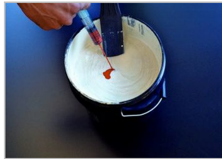
Fase 2 - Colorare Casa dei Sogni