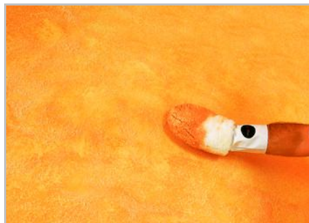
Fase 6 - Seconda mano, opzionale se si desidera 'invecchiare' il muro, ripassare dopo 15/30 minuti con il guanto inumidito di prodotto