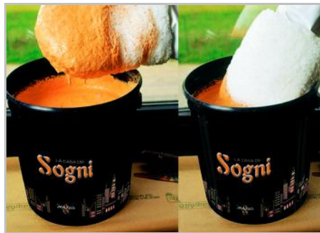
Fase 4 - Casa dei Sogni: bagnare abbondantemente, Trasparenze: bagnare leggermente