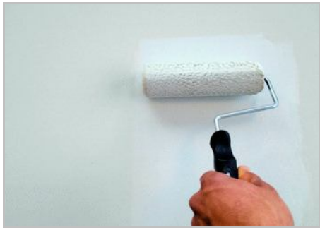
Fase 1 - Applicazione Primus Sabbia

La Casa dei Sogni si stende con un movimento non ordinato del palmo della mano rivestita dal nostro guanto bagnato abbondantemente di prodotto. Trasparenze si stende con un movimento non ordinato del palmo della mano rivestita dal nostro guanto bagnato leggermente di prodotto. Dopo circa 30 giorni la superficie sarà resistente ad un delicato lavaggio e comunque leggermente traspirante. Tempi di essiccazione 4/6 ore circa. Conservare in luogo fresco e asciutto al riparo dall'umidità e dal gelo.