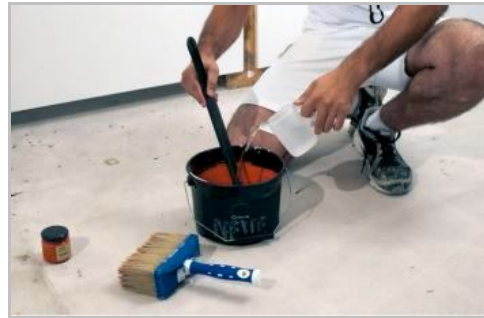
Fase 2 - Colorare Neve e aggiungere il 30% di acqua.