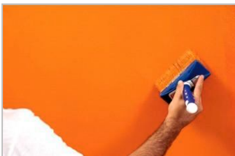
Fase 5 - Seconda mano "a tirare e sfumare"