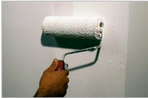
Fase 1 - Applicazione Primus Sabbia.

Totalmente lavabile con saponi non aggressivi. Tempi di essiccazione circa 3 ore. Conservare in luogo fresco al riparo dall'umidità e dal gelo.