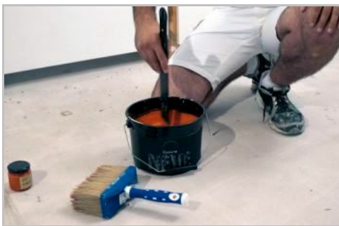
Fase 3 - Miscelare bene il prodotto