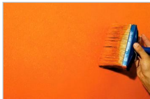
Fase 6 - Terza mano "a tirare e sfumare"