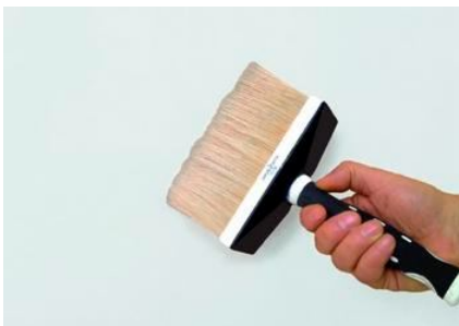
Fase 5 - Una volta asciutta la superficie si accenderà di stelle se preventivamente illuminata da luce diretta.