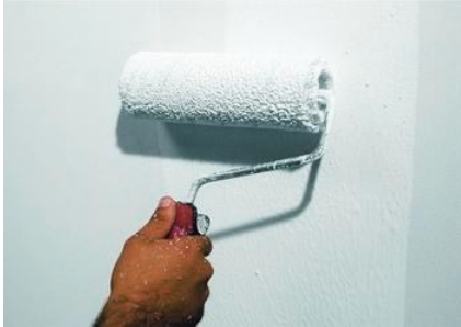
Fase 1 - Applicare una mano di Primus Sabbia a rullo su soffitti e pareti puliti e isolati.

Tempi di essiccazione circa 3 ore. Totalmente lavabile con saponi non aggressivi. Conservare in luogo fresco e asciutto al riparo dall'umidità e dal gelo.