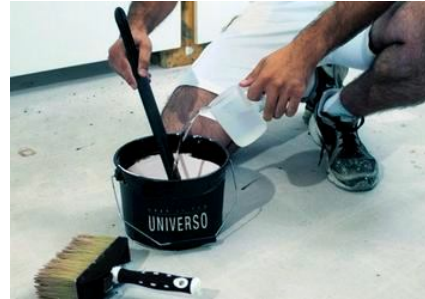
Fase 2 - Diluire Crea il Tuo UNIVERSO fino a un massimo del 10% con acqua.