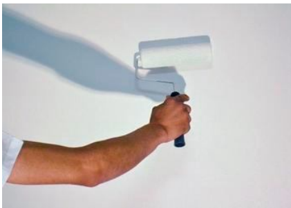
Fase 3 - Nel soffitto applicare il prodotto con un rullo a pelo medio (se necessario applicare una seconda mano)