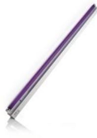
Fase 6 - Per ottenere un "Universo maggiormente illuminato", consigliamo l'utilizzo di una apposita lampada al neon ultravioletta da aggiungere al impianto illuminante esistente.